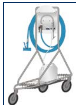
sur chariot inox